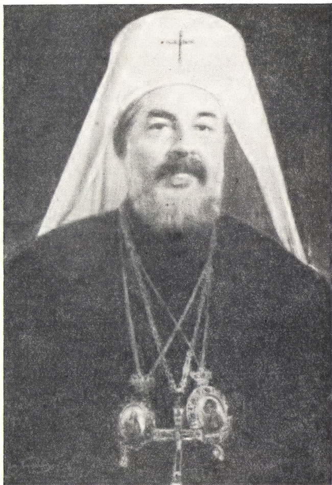
ПАТРИАРХ БОЛГАРСКИЙ И МИТРОПОЛИТ СОФИЙСКИЙ СВЯТЕЙШИЙ КИРИЛЛ